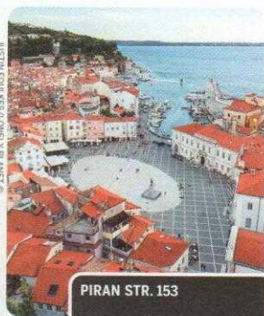
PIRAN STR. 153