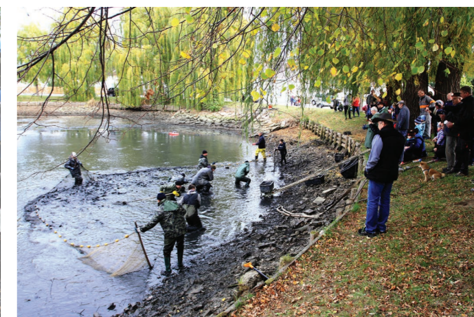
Výlov rybníka v roce 2019.