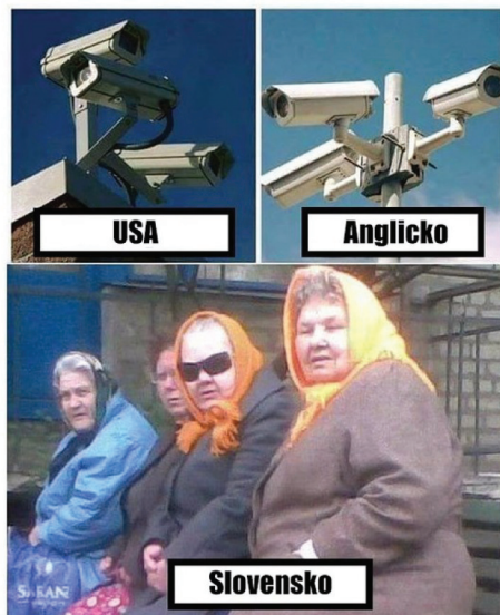
Obrázok 1 Zobrazenie senioriek ako klebetných žien 51

Jedným zo znakov ustálenosti stereotypov je aj to, že sa objavujú vo vtípoch, napr. vtipy o blondínkach, o Rómoch, v tomto prípade o seniorkách.