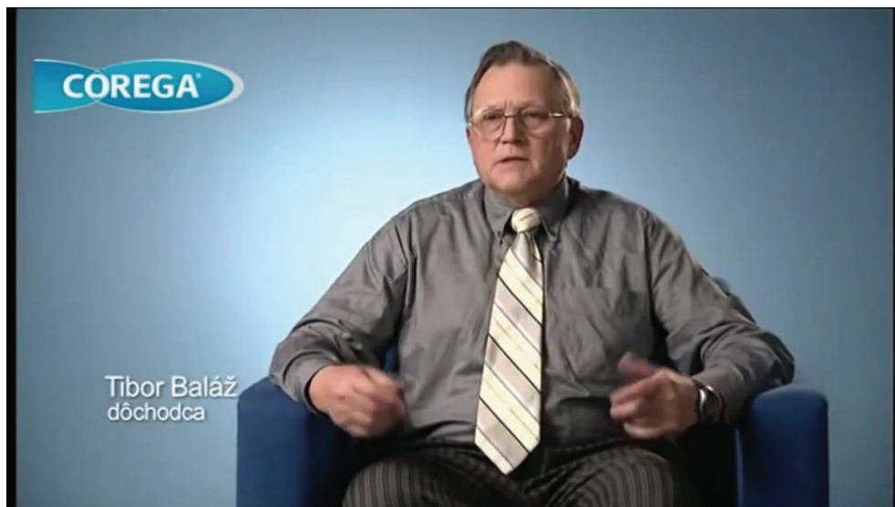
Obrázok 5 Senior v reklame na krém Corega