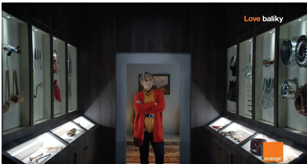
Obrázok 3 Seniorka vo svojej skrytej miestnosti, v ktorej má svoje tajné zbrane