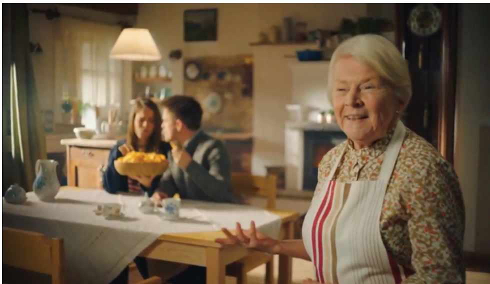
Obrázok 4 Seniorka z reklamy na Slovakia chips – Kotlíkové